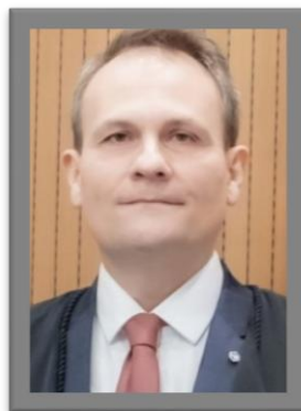
Márcio Schiefler Fontes

Categoria: Desembargador 09.12.2025 / 09.12.2027