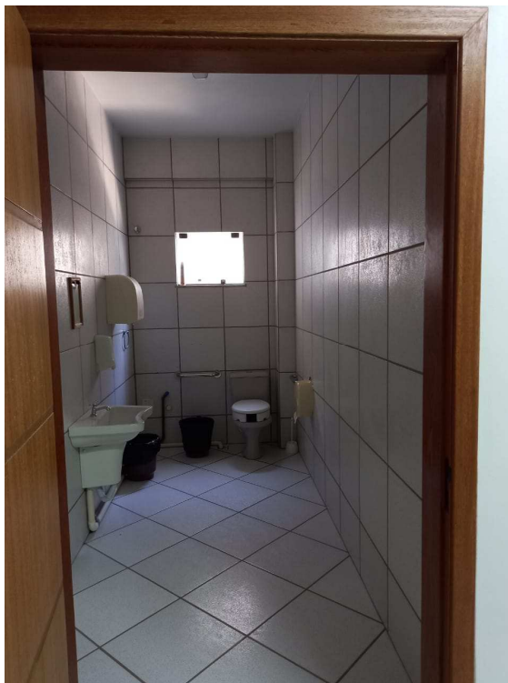
Banheiro de PNE