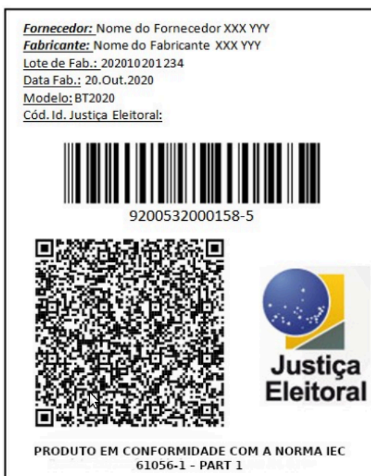
Figura 3 - Modelo de etiqueta da bateria