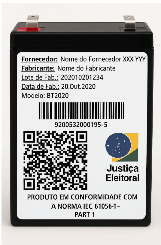
Figura 4 - Exemplo de etiqueta na bateria